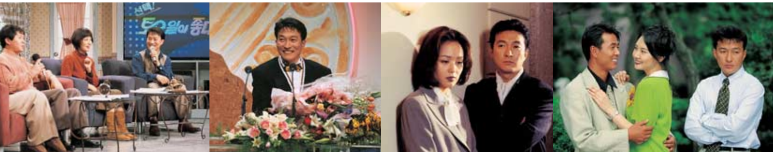
<선택 토요일이 좋다>의 MC(1994년), <종합병원>으로 <MBC 방송대상> 드라마 부문 우수상 수상(1994년), 수목 드라마 <이혼하지 않는 이유>(1996년), 특별 기획 드라마 <위험한 사랑>(1996년)(왼쪽 사진부터).

가장 힘들었던 배역은? <종합병원>! 고생스러웠고, 최선을 다했고, 열심히 찍었고, 동시에 그만큼 보람 있었던 드라마. 처음에 <종합병원>의 1년차 레지던트 김도훈 역을 맡았을 때만 해도 그 드라마가 그렇게 인기를 얻을 줄 몰랐다. 그저, 내 자신이 정말 의사가 된 듯 힘들고 바쁘게 병원을 뛰어다녔던 기억뿐이다. 하지만 그 속에서 나도 모르게 연기의 맛이 무엇인지 알게 됐던 것 같다. 함께 연기했던 배우들과의 호흡도 너무나 잘 맞았고, 시청자들의 사랑을 느낄수록 나 자신의 열정도 점점 뜨거워짐을 느꼈다. 연기가 내 몸 속에 녹아드는 경험을 갖게 해준 드라마가 <종합병원>이다.